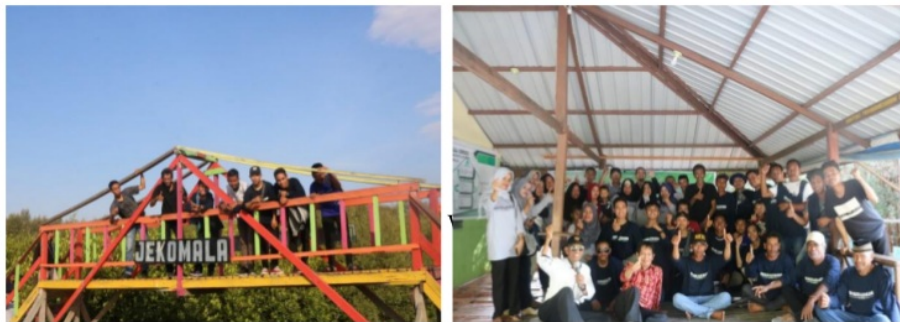
Gambar 7. Pelaksanaan studi banding di Wisata Mangrove Lantebung, Kota Makassar