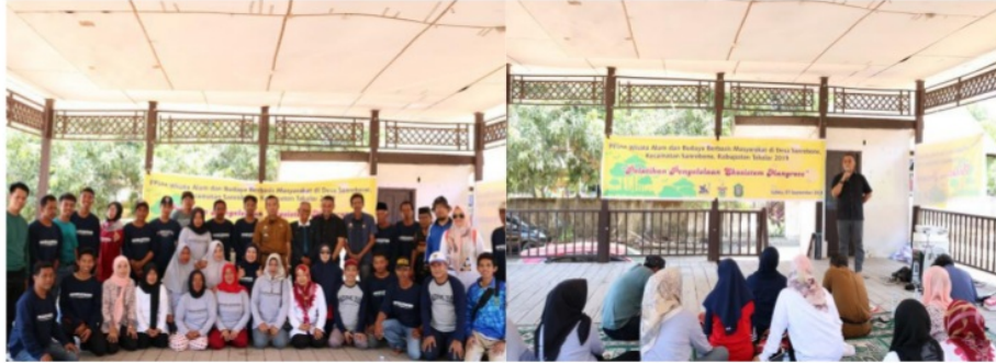
Gambar 4. Pelatihan pengelolaan ekosistem mangrove di Baruga rumah adat Sanrobone

Kegiatan "Pelatihan Penanaman dan Pengelolaan Ekosistem Mangrove" dilaksanakan pada tanggal 7 September 2019 yang dihadiri oleh 40 orang, terdiri dari seluruh kelompok generasi milenial di Desa Sanrobone, Pemerintah Kecamatan Sanrobone, Kepala Desa Sanrobone, Kepala Dinas Kelautan dan Perikanan (DKP) Kabupaten Takalar, dan segenap tokoh masyarakat Desa Sanrobone. Kegiatan ini menghadirkan dua narasumber, yaitu akademisi dari Universitas Hasanuddin dengan materi penanaman dan pengelolaan ekosistem mangrove, dan praktisi dari Dinas Kelautan dan Perikanan Kabupaten Takalar dengan materi kebijakan pengelolaan ekosistem mangrove di Kabupaten Takalar. (Gambar 4)