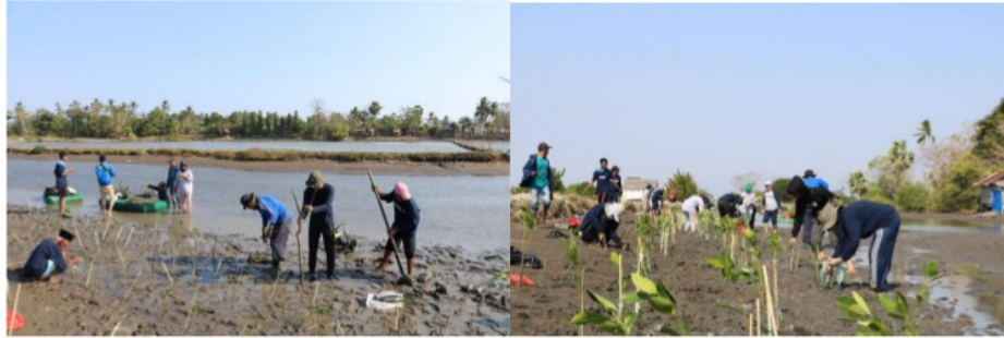
Gambar 5 Kegiatan penanaman mangrove jenis Rhizophora stylosa .