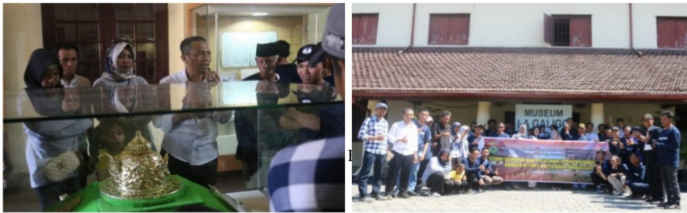
Gambar 6. Pelaksanaan studi banding di Benteng Fort Rotterdam, Kota Makassar

Kegiatan studi banding kelompok generasi milenial Desa Sanrobone dilakukan pada tanggal 16-17 Oktober 2019 di Kota Makassar pada dua tempat, yaitu Fort Rotterdam untuk belajar tentang wisata budaya dan Hutan Mangrove Lantebung untuk belajar tentang wisata mangrove (Gambar 6 dan Gambar 7). Kegiatan ini bertujuan untuk pengembangan sumber daya manusia khususnya generasi milenial di Desa Sanrobone dalam bidang wisata alam dan budaya, serta penguatan kelompok yang telah terbentuk.