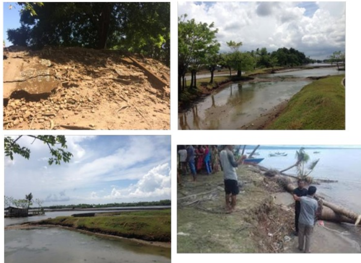
Gambar 2. Identifikasi areal yang mengalami abrasi di sekitar Benteng Sanrobone dan estimasi kegiatan rehabilitasi melalui penanaman mangrove

Kegiatan identifikasi lokasi rehabilitasi hutan mangrove di Desa Sanrobone bertujuan untuk mengetahui semua titik lokasi di wilayah pesisir Desa Sanrobone yang mengalami abrasi dan akan direhabilitasi dengan penanaman mangrove. Abrasi adalah suatu proses pengikisan pantai oleh tenaga gelombang laut dan arus laut yang bersifat merusak (BNPB, 2012). Abrasi terjadi disebabkan oleh gelombang akibat hembusan angin di permukaan air. Saat gelombang mendekati pantai, gelombang mulai bergesekan dengan dasar laut yang menyebabkan terjadinya turbulensi dan membawa material dari dasar pantai atau menyebabkan terkikisnya pasir di pantai (Pratikto et al. , 1997) (Gambar 2).